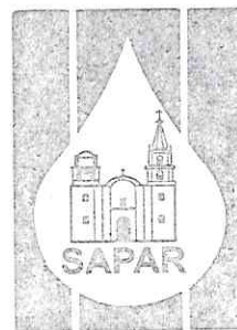
Sistema de Agua Potable y Alcantarillado de Romita, Gto